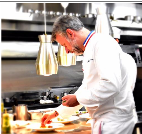
「ラメール ブラジエ」オーナーシェフ マチュ ヴィアネ氏

神戸ポートピアホテルは、2019年5月16日(木)～19日(日)の期間、ホテル31階フレンチレストラン「トランテアン」で、「トランテアン美食フェア 第15回マチュ ヴィアネの料理を楽しむ会」を開催いたします。仏ミシュランガイド二つ星レストラン「ラメール ブラジエ」のオーナーシェフ、マチュ ヴィアネ氏による新作メニューを披露するフェアを中心に、鉄板焼料理とのコラボレーションイベントやMOF ソムリエによるイベントも併せて開催いたします。「ワールドレストランアワーズ 2019」クラシカル部門最優秀賞に輝いた「ラメール ブラジエ」のヴィアネ氏が、華麗なるフレンチの世界で魅了いたします。