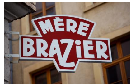
[ラメールブラジエ] (仏・リヨン)