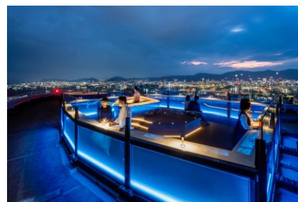
ソラフネ神戸 夜の部 イメージ