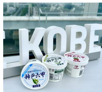
アイスクリーム イメージ