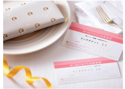
ギフト券 イメージ