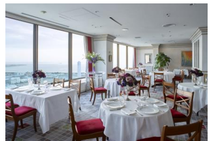
フレンチレストラン トランテアン

レストラン総合案内 Tel. 078-303-5207 (10:00~17:30)