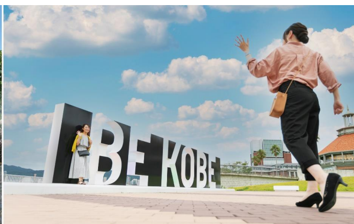
（左から）中央緑地公園、ポーアイしおさい公園（写真はイメージ）