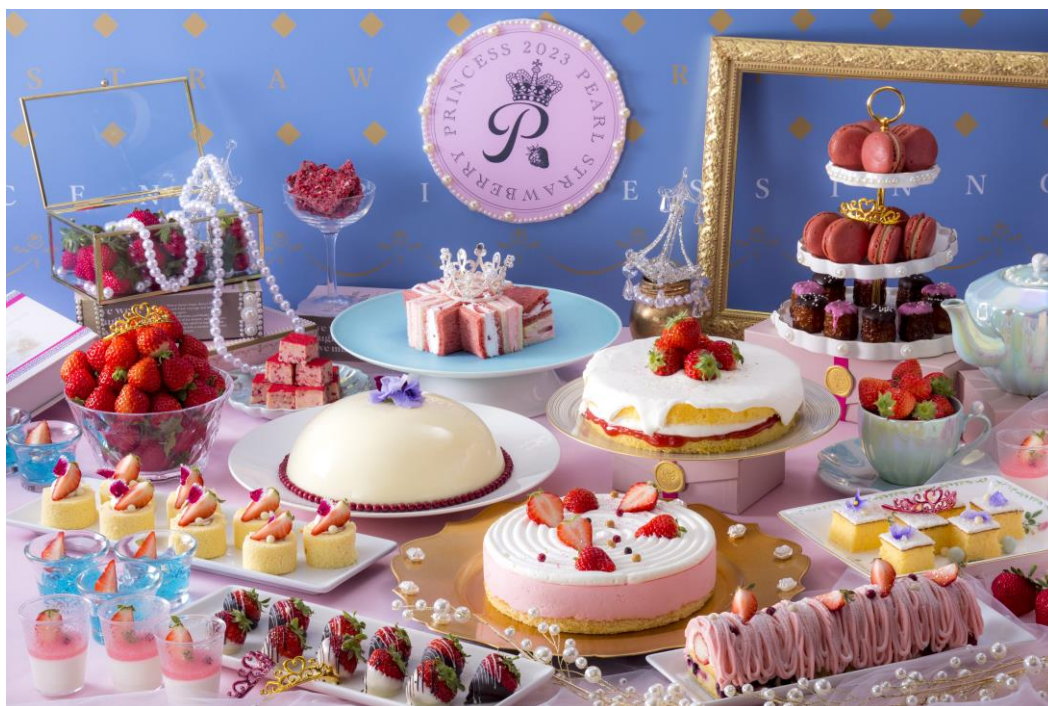
SOCOスイーツbuffe PEARL STRAWBERRY PRINCESS シーズン2「イノセント プリンセス」

https://www.portopia.co.jp/restaurant/detail/soco/fair/#!fair-71