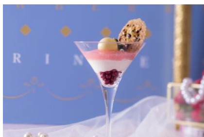
ウェルカムスイーツ