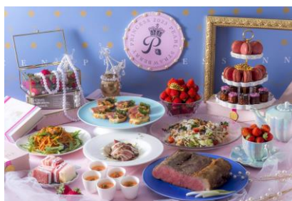
セイボリー（料理類）一例