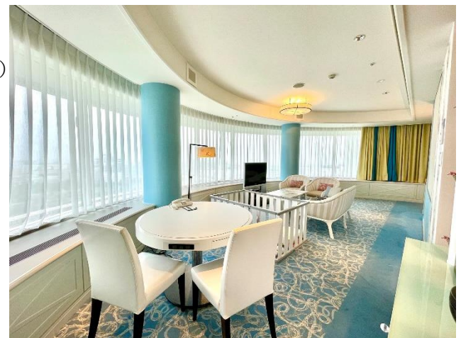
ペットフレンドリールーム 南館ジュニアスイート