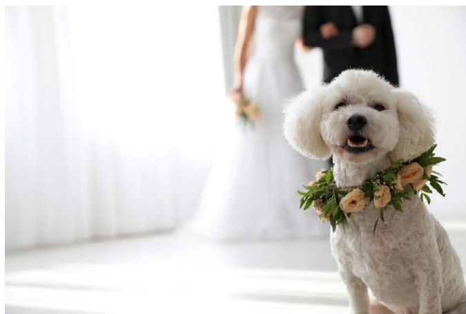
ペットフレンドリーウエディング イメージ

神戸ポートピアホテルは、ペットと一緒に結婚式を挙げたい、というお客さまのニーズを受け、開放的な屋外プールサイドでペットと一緒にパートナーとの将来を誓うことができるペットフレンドリーウエディングプランの販売を開始しました。このプランでは、2022年6月より開始した当ホテルのペットフレンドリールームに泊まることができ、ペットと一緒に過ごす快適なホテルウエディングが実現します。