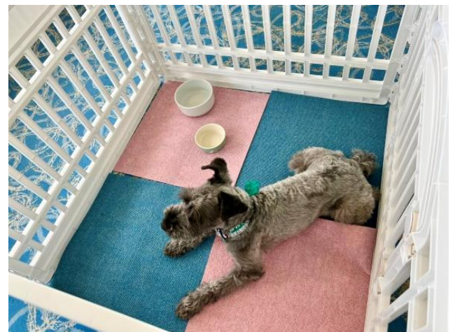
ペットサークル 一例