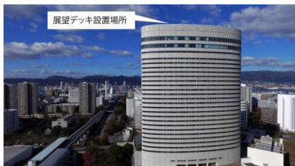
展望デッキ設置場所

ポートピアホテル本館の屋上は高さ約110mにあたり、街の建物や六甲山ろくの家々の灯りが立体的に見える高さです。この高さは、当社の創業者、中内力が、ホテル建設前にヘリコプターに乗って神戸の街が最も美しく見えるとしてこの高さを指定した、と伝えられています。