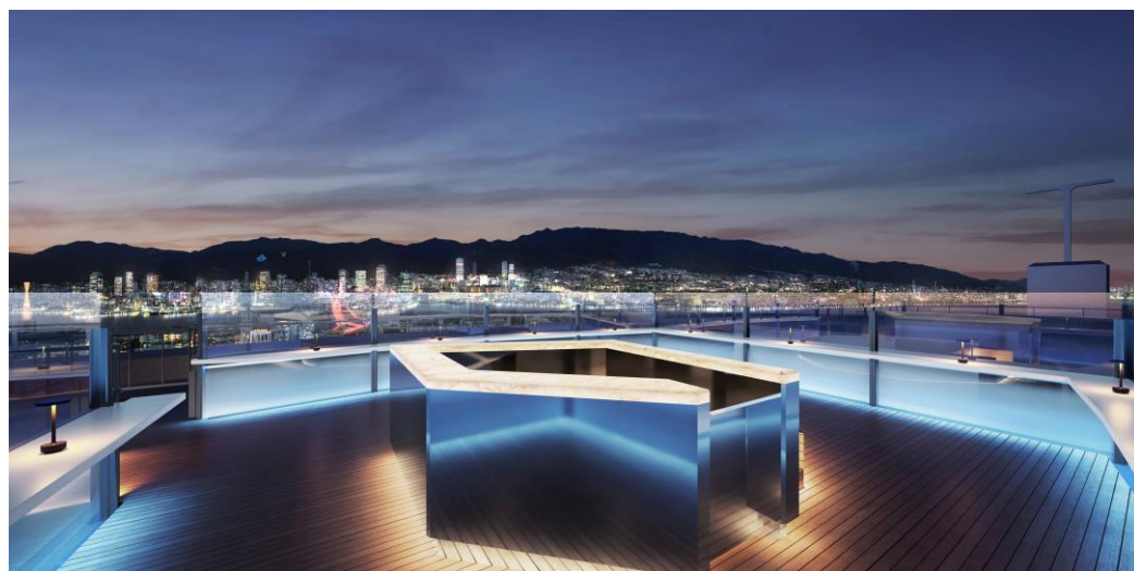
屋上展望デッキ（夜）イメージパース

神戸ポートピアホテルは、ホテル本館の屋上に屋外型の展望施設「屋上テラス ソラフネ神戸」を2022年7月29日（金）にオープンいたします。六甲山系や神戸の街、そして大阪湾などを一望できる、360°パノラマビューが広がる開放的な展望スポットとして、神戸観光の魅力創出につなげてまいります。