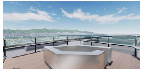
日中の景色イメージ（パース）