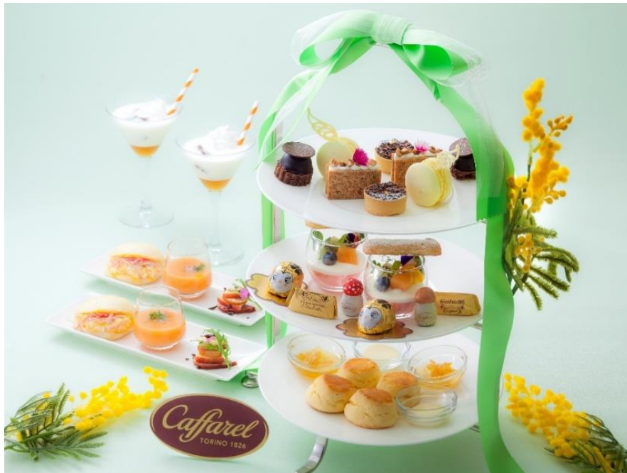
春のアフタヌーンティーセット～Primavera with Caffarel～（写真は2名さま分、オプションドリンク付）

【2022年3月1日～5月8日限定】イタリア・トリノ発祥の老舗チョコレートブランド「カファレル」とコラボレートしたアフタヌーンティーセット。お皿に散りばめた可愛いチョコレートや、カファレル社のチョコレートを使ったパティシエ特製スイーツで春の訪れをお楽しみいただけます。