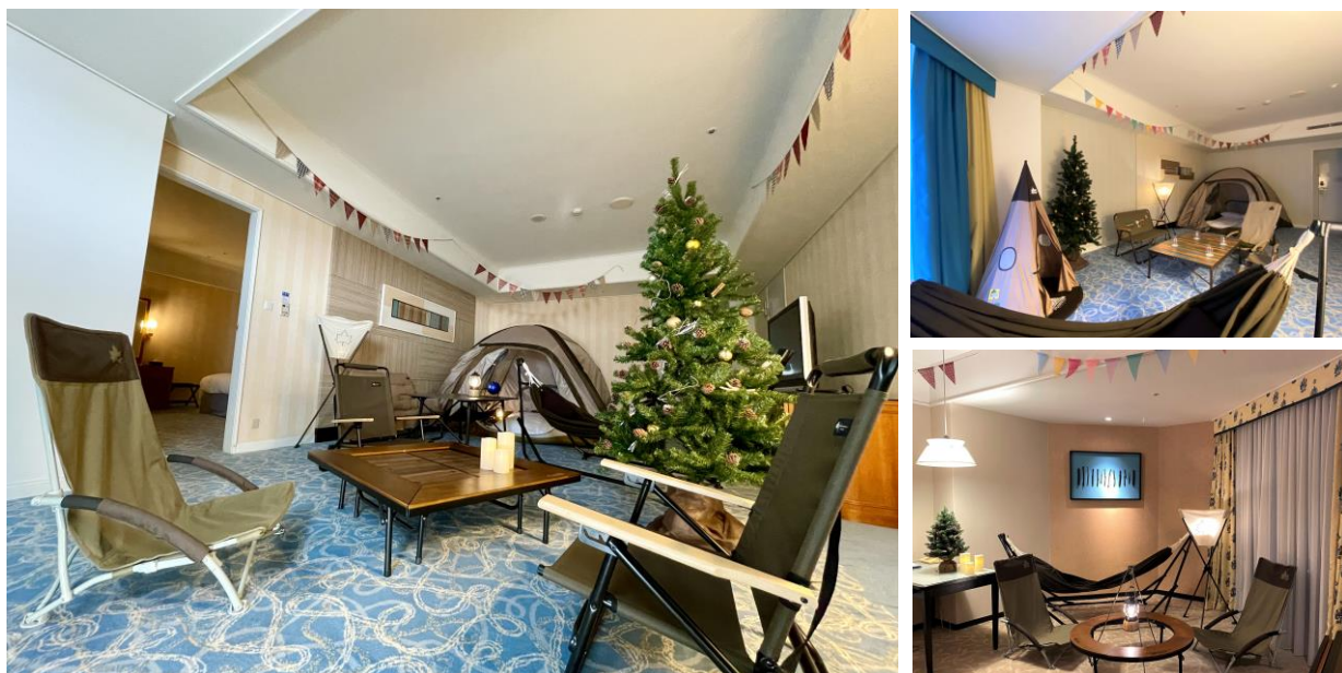
『グランピングスイート』（写真左）『グランピングファミリースイート』（写真右上）『グランピングツイン』（写真右下）

神戸ポートピアホテルの期間限定コンセプトルーム『グランピングルーム』が、クリスマスシーズンに向けてツリーやキャンドル風のライトでクリスマス仕様にグレードアップ。客室内には人気アウトドアブランドのキャンプ用品のほか、ホームプラネタリウム、クリスマスツリーやガーランド、キャンドル風のライトなどを設置し、快適な室内で“クリスマス&冬キャンプ”気分を味わえます。また、12月1日(水)～は夕朝食付きプランで、パーティーメニューさながらのクリスマス特別ディナーをお部屋にお届けいたします。