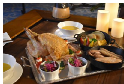
クリスマス特別メニュー(イメージ)

宿泊予約係 Tel. 078-302-1122 (10:00a.m.～6:30p.m.)