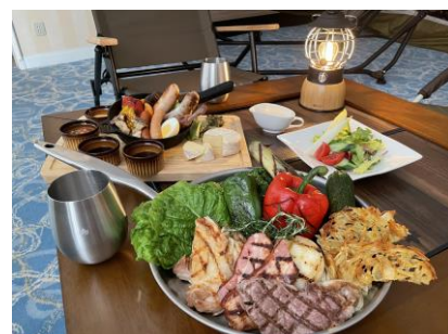
スペシャルアウトドアメニュー(イメージ)