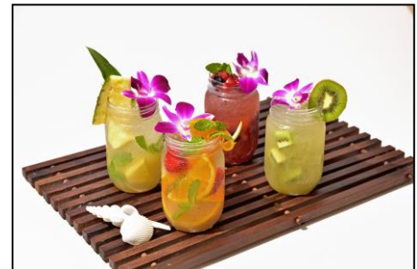
リゾート感を味わえるフルーツジャー

スパークリングワイン、もしくは、よく冷えたソーダで仕上げるノンアルコールタイプもご用意。お子さまもリゾート感あふれるドリンクをお楽しみいただけます。今年は新たにミックスベリースムージー、グリーンスムージーもご用意。見た目も可愛いドリンクは夏の青空をバックに気分を盛り上げます。(各ソーダアップ1,300円、スパークリングワインアップ1,700円)