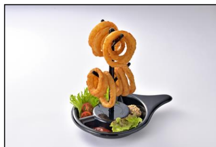
オニオンリングツリー 900円