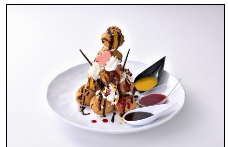
シューアイスタワー 1,200円 (ソース:チョコ、マンゴー、ベリー)