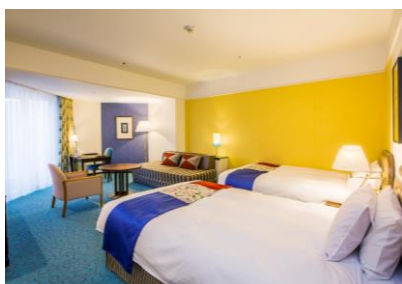
バルコニー付き南館サウスリゾートフロア

ルーフガーデンプールやポートピアナイトプールのご利用がセットになった宿泊プラン、ホテル内レストランでのbuffet利用とプールのご利用をセットにした食事付きプランをご用意しています。神戸、三宮から10分の海の上でゆったりとしたリゾートを満喫できます。