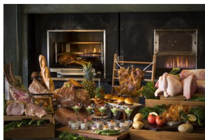
人気のbuffetレストラン GOCOGU の食事つきプラン