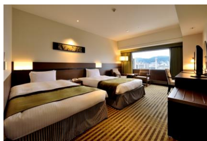
眺めのよい本館スーペリアフロア