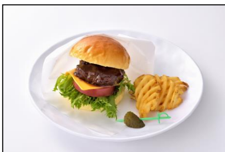
ビーフバーガー 1,200円

プチシューアイスのタワーにお客さまご自身で3種のソースをかけていただくとはとても可愛いスイーツの出来上がり！完成するまでの楽しさ、見た目の可愛いのはインスタ映えすること間違いありません。