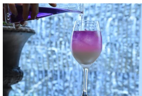
「ベルクール」の「マロウブルーオアシス」