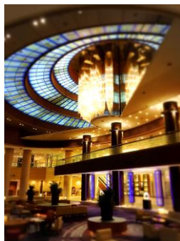
メインロビーのライトアップ

内容 ; かつてモナコのグレース公妃が愛したとされるハーブティー「マロウブルー」カルピスを調合してラベンダーを加えたベルクールオリジナルハーブドリンクです。マロウブルーは喉の痛みや気管支炎を鎮めるのに効果があるとされています。「マロウブルーオアシス」の青紫からピンク色への変化とラベンダーの香りが気分を落ち着かせ、癒してくれます。