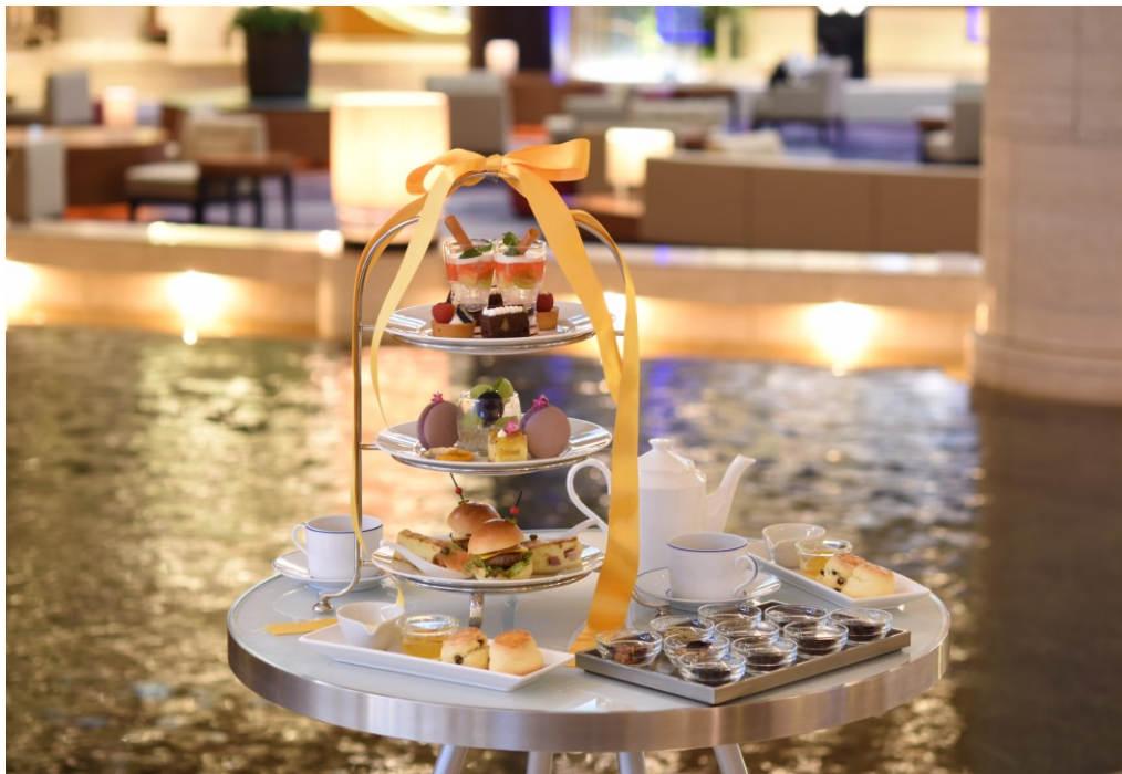
ティーラウンジ ベルクール 「アフタヌーンティーセット～収穫祭～」

コロナ禍のストレスを解消し、天井高17mのロビーを臨む水辺の空間で、スイーツや紅茶を優雅に味わう非日常のほっとするひとときをお過ごしいただけます。