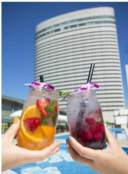
リゾート感を味わえるフルーツジャー