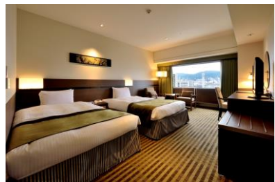
眺めのよい本館スーペリアフロア