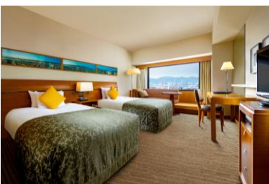
専用ラウンジを備えた本館エグゼクティブフロア