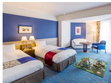
開放的な南館サウスリゾートフロアの客室