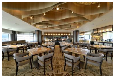
プール&ブッフェプランのGOCOCU店内