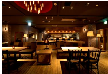
ナイトプール&バールプランのEREMO店内