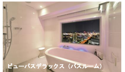
ビューバスデラックス（バスルーム）