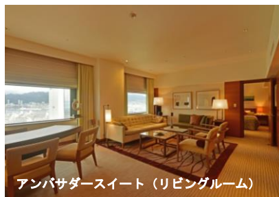
アンバサダースイート（リビングルーム）