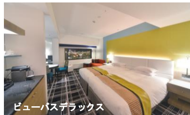
ビューバスデラックス