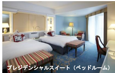
プレジデンシャルスイート（ベッドルーム）