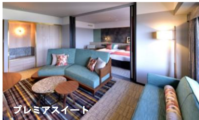
プレミアスイート