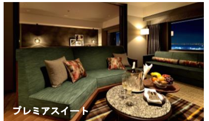
プレミアスイート