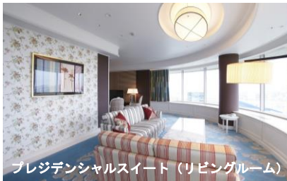
プレジデンシャルスイート（リビングルーム）