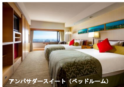
アンバサダースイート（ベッドルーム）