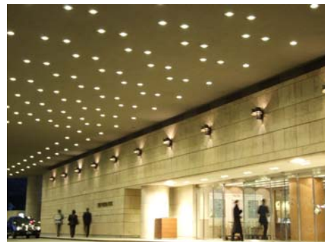
変更後 LED ダウンライト

KEMS(ケムズ/神戸環境マネジメントシステム)とは あらゆる規模・業種の組織の中で、排ガスや電気などの環境負荷を管理・低減に取り組む神戸独自の環境マネジメントシステム。取り組みには2つのステップがあり、「こうべ環境フォーラム」の審査員による確認審査を受け認証される。