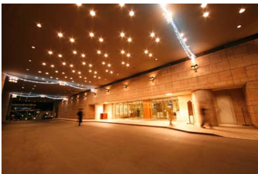
変更前 ハイビーム電球・ボール電球